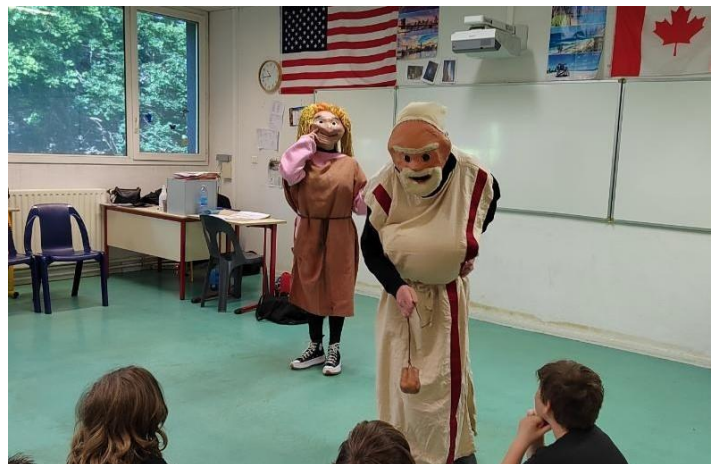
Représentation théâtrale romaine