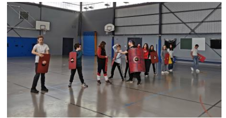
Techniques de la gladiature