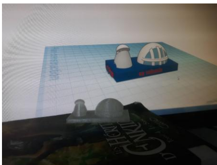
Cité des Sciences à Valence