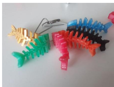
En vente à 2 € pour aider à financer les futurs voyages