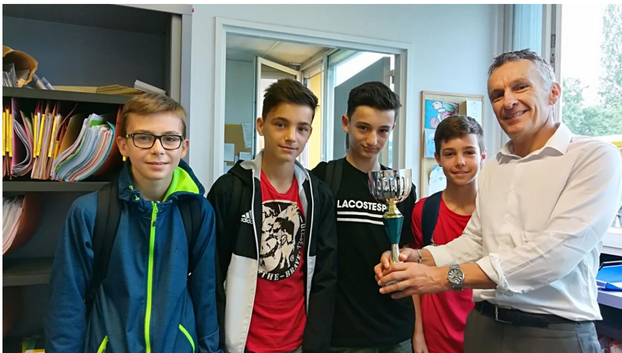
Remise de la coupe du Championnat de Handball 2017/2018 des élèves de M.MONEGHETTI, enseignant d'EPS