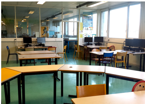
Une salle de Technologie