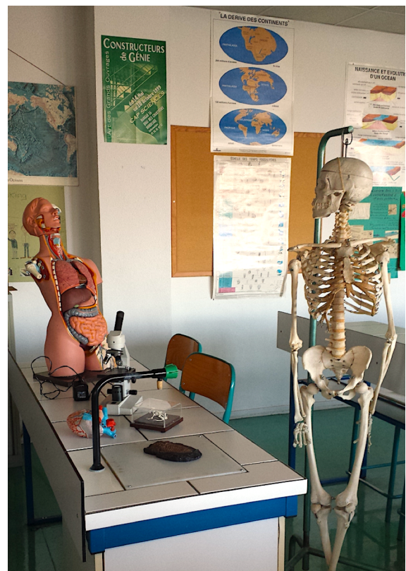
Une salle de SVT