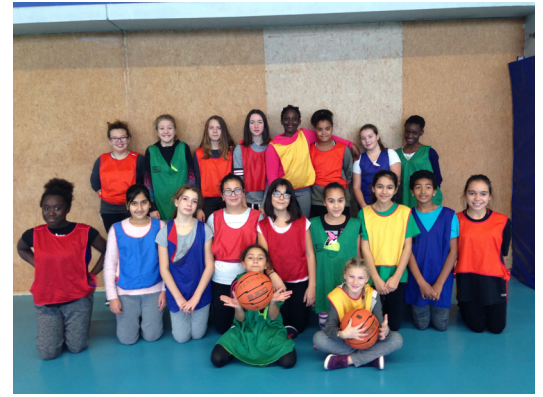
Les filles de l'AS Basket

L'AS Basket est différente de l'OPTION BASKET car elle se déroule le mercredi après-midi ou le midi et est accessible à tous les élèves. Les élèves faisant l'Option basket sont obligés de faire partie de l'AS pour représenter le collège lors des compétitions.