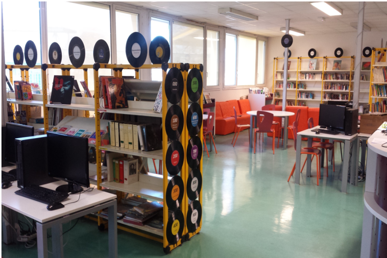
Le CDI, un lieu où on aime se retrouver