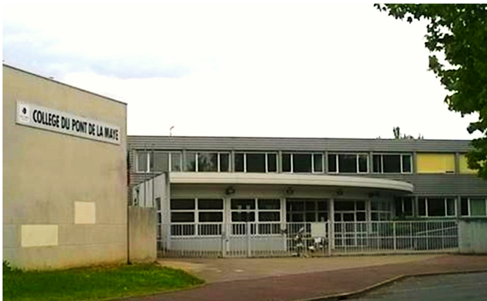
L'entrée du collège du Pont de la Maye