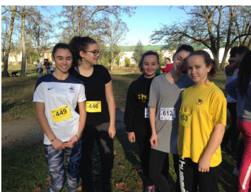
Quelques élèves participants

Chaque année, de nombreux élèves de l'AS représentent le collège en participant au cross de district à Bègles-Mussonville, qui rassemble tous les collèges du secteur. Cette année, deux équipes se sont qualifiées pour le cross départemental.