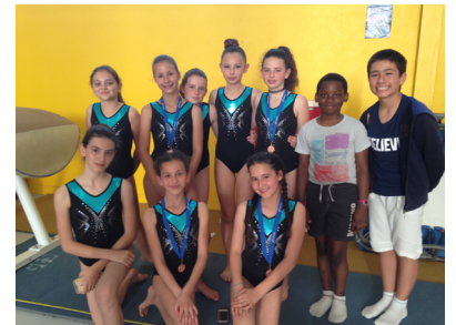
L'équipe de Gym